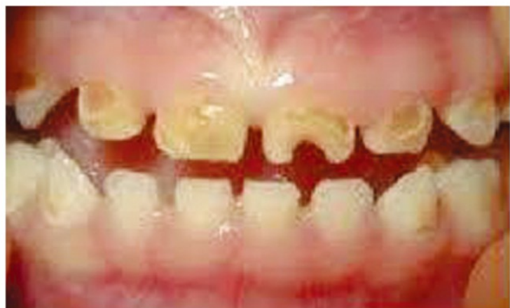
むし歯の多発した児童

特に 幼児期、学童期のむし歯予防 は「8020」達成のための、スタート時期で大変重要です。しかしこの時期のむし歯予防は個人の努力（食生活の改善、甘味摂取制限、歯磨き）だけでは難しくむし歯多発児童も見受けられるのが現状です。