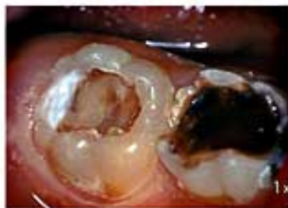
Cで表す。 放っておけばこのようにもなります。