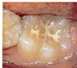
むし歯になりやすい歯の「みぞ」を削らずに合成樹脂で埋める方法です。