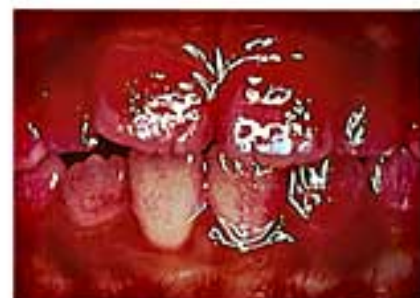
染め出し後（汚れ部分に色が付きます）