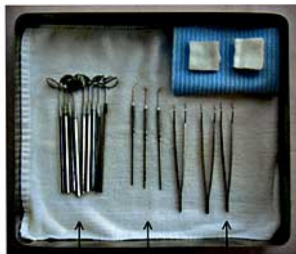
ミラー 探針 ピンセット