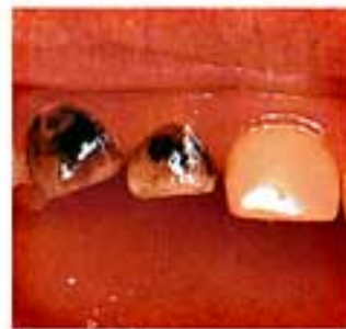
むし歯の進行止めの薬塗布（黒くなる）